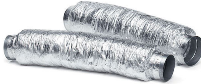
Canalización flex silenciada Ø 150 9700 603