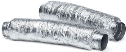
Canalización flex silenciada Ø 120 9700 602